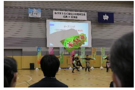
②よさこいダンス「華鼓舞 はなこまい」 (SSC平和台)