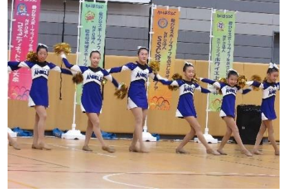
⑨チアダンス「PeaceAngels ピースエンジェルス」 (SSC 平和台)