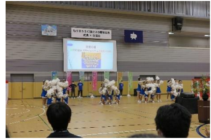
⑩チアリーディング「SSC エンジェルス」 (SSC 谷原)