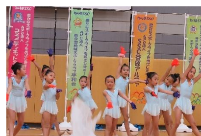
⑧カラーリリー新体操クラブ (SSC 大泉)