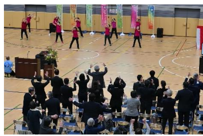
⑦リズムムーブメント「藤の花」 (SSC 上石神井)