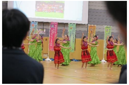
③3世代フラダンス「Kupulau クプラウ」 (SSC 光が丘)