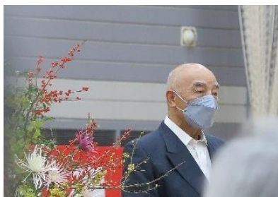
6. 各 SSC 理事長紹介