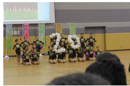
① SSC 光が丘チアダンスチーム「Luna ルナ」(SSC 光が丘)