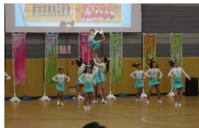
⑤チアリーディング「チアキャッツ SSC 大泉」 (SSC 大泉)