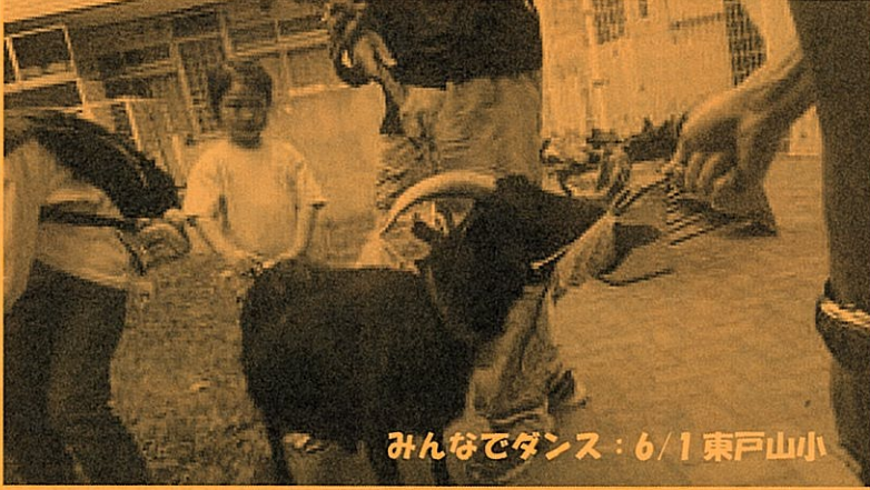
みんなでダンス：6/1 東戸山小