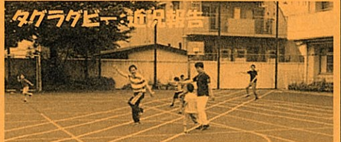
タグラグビー：6月報告