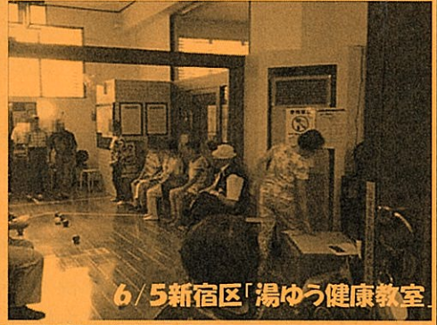
6/5新宿区「湯ゆう健康教室」