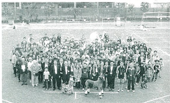
オリパラ馬術競技をポニーも応援！