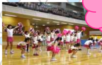
※写真は昨年度の交流会の様子です