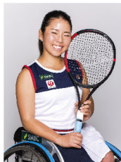
上地 結衣 選手 車いすテニス パリ2024パラリンピック金メダリスト